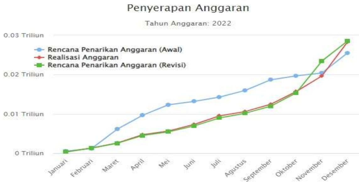
Grafik 2. Progress realisasi anggaran setiap bulan pada TA 2022