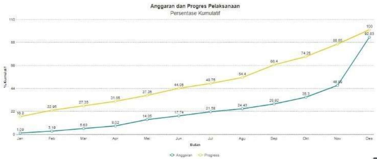
Grafik 1. Progress realisasi anggaran dan pelaksanaan setiap bulan pada TA 2021