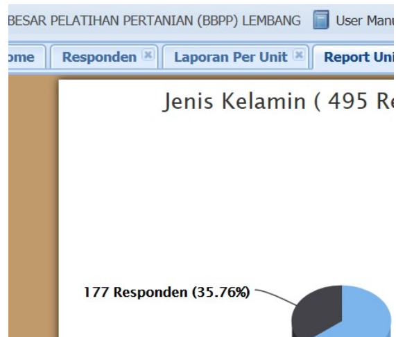
Diagram 2. Jumlah Responden Pengguna BBPP Lembang Berdasarkan Jenis Kelamin Semester II Tahun 2019

Selanjutnya jika dilihat dari karakteristik responden berdasarkan jenis kelamin, yakni jumlah responden laki-laki lebih mendominasi sebanyak 318 orang (64,24%) dan jumlah perempuan responden sebanyak 177 orang (35,76%).