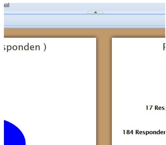
Diagram 3. Jumlah Responden Pengguna BBPP Lembang Berdasarkan Tingkat Pendidikan Semester II Tahun 2019

Selanjutnya jika dilihat dari karakteristik responden berdasarkan jenis kelamin, yakni jumlah responden laki-laki lebih mendominasi sebanyak 318 orang (64,24%) dan jumlah perempuan responden sebanyak 177 orang (35,76%).