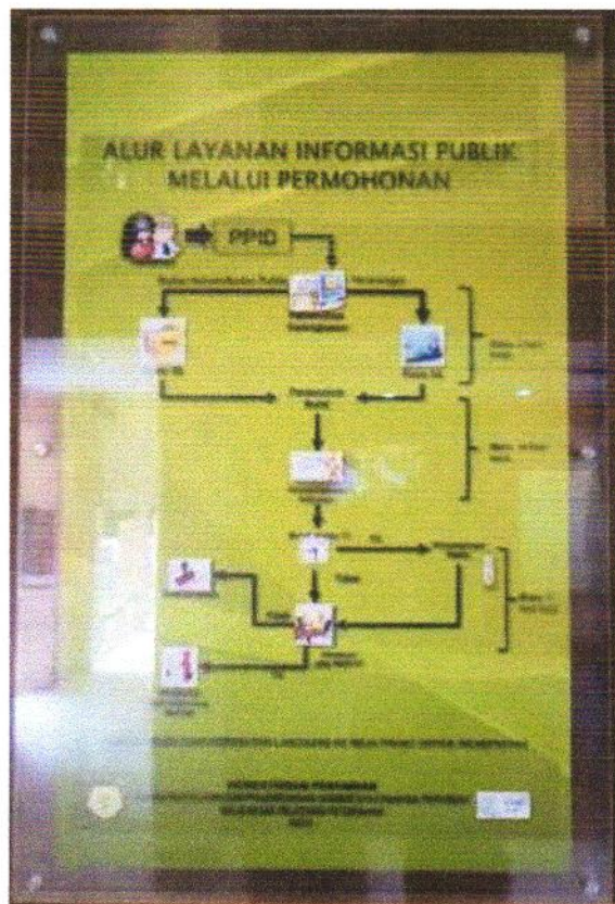
Gambar 2.1 Alur layanan Informasi Publik BBPP Batu