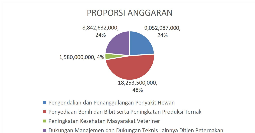
Gambar 1. Proporsi Anggaran per Kegiatan Tahun 2023